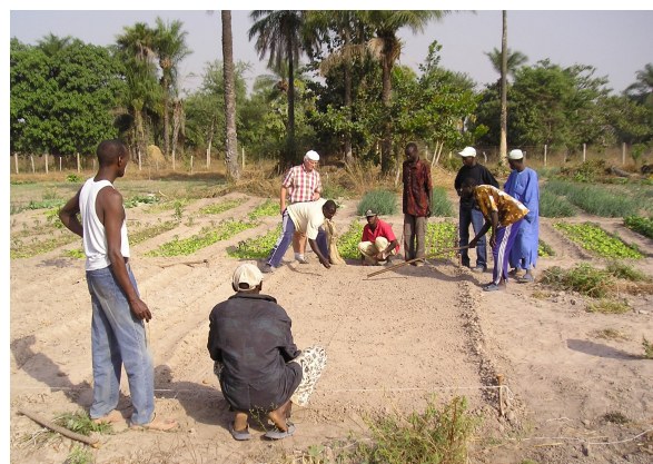
Les in het klaarmaken van aardappelveldjes

Als iets mislukt doet de Europeaan het nog eens over. Voor de Afrikaan is dat lastiger. Hij gaat liever iets anders doen. Het bijzondere was echter dat de kilo's die wel geoogst werden een heel hoge prijs opbrachten. Dus wilden ze het nog eens over doen. Opnieuw werden veldjes aangelegd. Nu alleen ruggen met de aardappelen dieper weggelegd. De zavelachtige riviergrond leent zich er goed toe. We hadden nu ook vooraf met hen de compost met grond gemengd. De meetstok kwam er opnieuw bij, nu om ook te meten hoe hoog het water in de geulen zou staan en waar de aardappel dan moest liggen. Op hoop van zegen gingen de knollen opnieuw de grond in, op een drietal tuinen. Ditmaal was ook de oogst goed en ook weer de prijs.