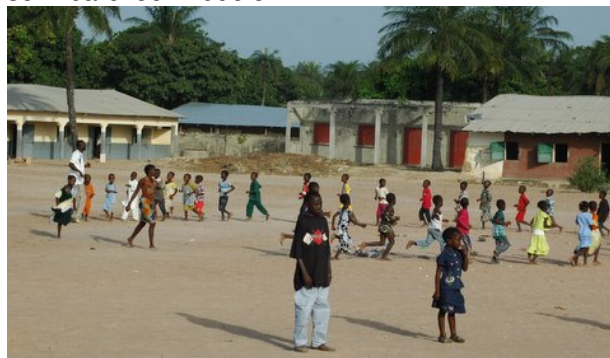
Spel op het schoolplein

Na de bouwactiviteiten in de afgelopen jaren met hulp van Agro Casa, is de gebouwensituatie voor Senegalese begrippen nu goed te noemen. Men wacht nog op de afronding van een sponsorproject van een Italiaanse organisatie. Wat blijft is een behoefte aan vaktechnische ondersteuning van de docenten en aan een flinke aanvulling op de beschikbare leermiddelen.