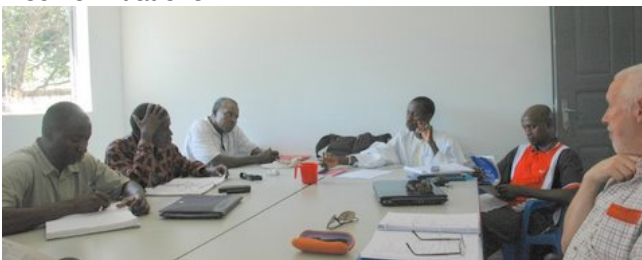
Overleg met de partners

Doel van de stichting is het bereiken van een situatie waarin de partnerorganisaties in de Casamance geheel zelfstandig uitvoering kunnen geven aan de activiteiten voor de ontwikkeling van de regio, zoals omschreven in onze missie. De rol van Agro Casa komt dan meer op de achtergrond. Agro Casa staat uiteraard open voor nieuwe initiatieven.