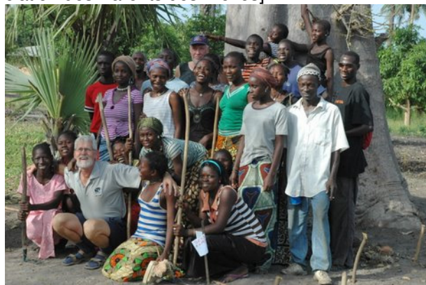
De eerste groep leerlingen

In de afgelopen jaren is door onze partners veel werk verzet voor de realisatie van het trainingscentrum Centre d'Initiation Pratique Horticole (CIPH). De verantwoordelijkheid voor het centrum berust bij het bestuur van het primaire onderwijs APE [Association des Parents des Elèves].