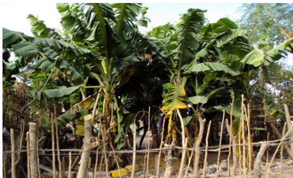
Bananenbomen groeien goed op was- en toiletwater