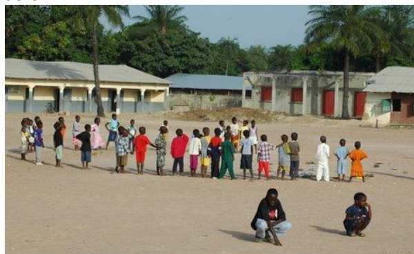
Spel op het schoolplein

We kunnen constateren dat de basisschool met bijna 650 leerlingen zich, met steun van van Agro Casa, ontwikkeld heeft tot een voorbeeldschool in de regio. Met regelmaat worden er bovenschoolse bijeenkomsten georganiseerd voor instructie en voorlichting aan onderwijzend personeel van elders.