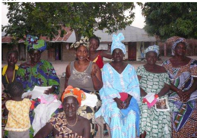
De enthousiaste werkgroep sanitatie

De eerste pilots van een gecombineerde bad- en toilet-eenheid zijn zo goed bevallen dat er nu een serie van 6 in aanbouw is. De sanitatiegroep heeft met adviseur Henk Smink van OMRIN daarvoor een selectie gemaakt verspreid in het dorp van de aangeboden locaties.