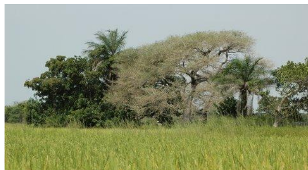
De rijstvelden in november