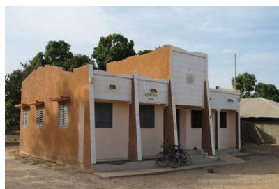
Het gebouw van UPAC en CREC