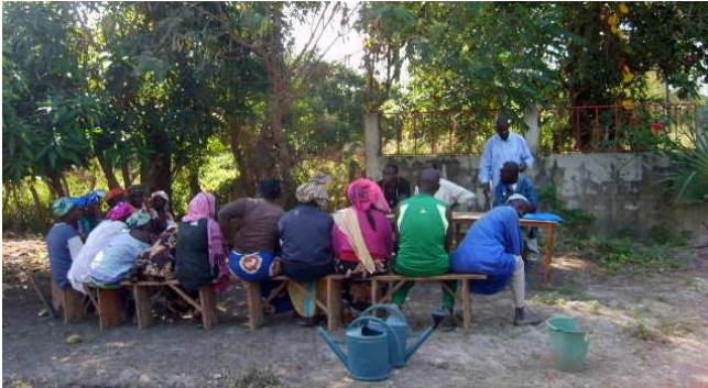
De nieuwe doelgroep krijgt instructie

verklaring zou zijn dat dit vak toch als minderwaardig wordt gezien. Jongeren dromen meer van techniek. Na een serieus overleg op dorpsniveau is nu een groep enthousiaste volwassen vrouwen en enkele mannen actief. Zij brengen onder begeleiding van een nieuwe instructeur de schooltuin in productie en leren voor hen nieuwe technieken. Er is een verdeelsleutel gemaakt van de opbrengsten. Dat betekent inkomsten voor de volwassen leerlingen en kostendekking voor het centrum. Omdat een aantal van hen analfabeet is en geen Frans spreekt, wordt nagedacht om alfabetiseringsonderricht te geven in Abéné.