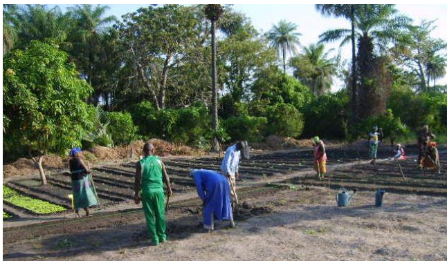
en is veelbelovend aan de slag gegaan