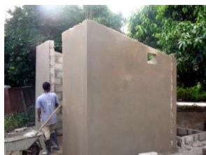
en weer een unit in aanbouw