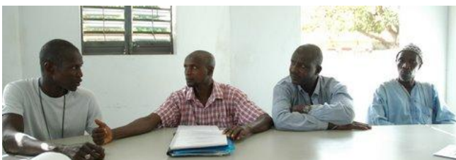
Overleg met de partners

Doel van de stichting is het bereiken van een situatie waarin de partnerorganisaties in de Casamance geheel zelfstandig uitvoering kunnen geven aan de activiteiten voor de ontwikkeling van de regio, zoals omschreven in onze missie. De rol van Agro Casa komt dan meer op de achtergrond. Agro Casa staat uiteraard open voor nieuwe initiatieven.