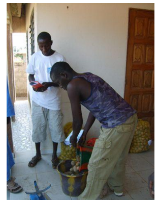
Verkoop van pootgoed

De vakgroep aardappelen die enkele jaren geleden van start is gegaan, onderhoudt nu zelfstandig contacten met Kafutafarm in Gambia. Het Nederlandse management aldaar is bereid, voorzover mogelijk, het project te ondersteunen. In- en verkoop van het pootgoed is een belangrijk onderdeel van het Fonds de Roulement. UPAC is verantwoordelijk voor de organisatie van het geheel.