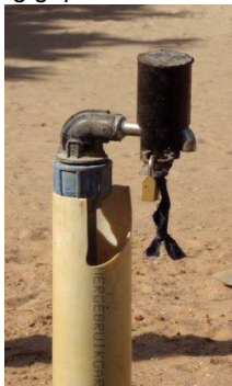
Het slot ging er op

Er is druk gezet op de afnemers door de zeer matige betalingsdiscipline mbt de waterrekeningen. Dat mensen die thuis bezorgd krijgen en moeten betalen is een hele cultuurverandering. Door dorpsoudsten, kerk en moskee is gewezen op het grote belang van het goede drinkwater maar ook op 'niet halen zonder betalen'. Toen een aantal wanbetalers werd afgesloten, zijn veel rekeningen alsnog voldaan.