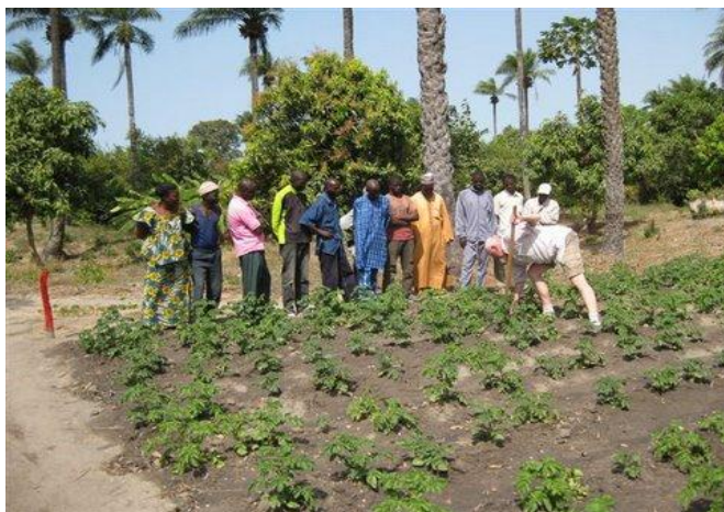
De telersgroep aardappelen

Dankzij een donatie van speciale poters voor de tropen door HZPC en Farm Frites Gambia is opnieuw een praktijkproef gedaan met aardappelen. Dit is door de warmte en wisselende vochtigheid een lastige teelt. De resultaten waren wisselend.