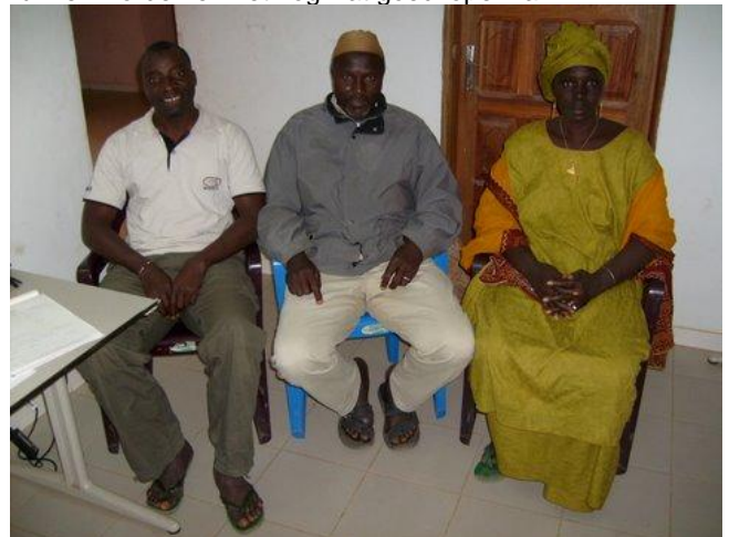
Enkele leden van de werkgroep sanitatie

Gelet op het goede resultaat, animo en enthousiasme is de bouw van nog enkele units voorbereid en inmiddels is de 2 e unit ook gestart. Het ontwerp is op basis van de ervaringen wat aangepast en zó dat meer lokale materialen gebruikt kunnen worden en het nog wat goedkoper kan.