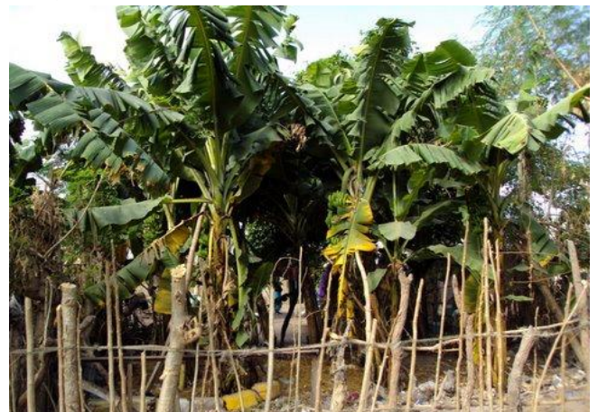
Bananenbomen groeien goed op was- en toiletwater

Stimulerend is dat de groei van de gewassen merkbaar beter is. Ook de hygiëne op het erf is verbeterd en dat zal hopelijk leiden tot een beter gezondheid. Het bewustzijn daarover is duidelijk merkbaar.