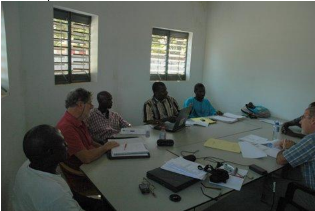
Overleg bankbestuur en leden van de missie

De microbank CREC is in een zeer kritieke situatie verzeild geraakt. De verhouding uitstaand geld, aflossing en ingelegd spaargeld is fors uit balans. Op basis van een analyse door adviseur Gjalt Benedictus is tijdens demissie in november heel intensief overlegd met bankbestuur en management over een actieplan.