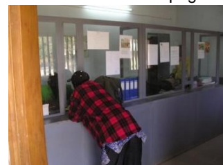
Tevergeefs bij de balie

InterCREC niet goed werkt. Er gaat structureel te weinig verantwoordelijkheid van InterCREC uit. Ondanks allerlei pogingen blijft de bank tekortschieten in rapportages en komt ook de beoogde groei niet tot stand. Een verandering in de organisatie van de bank vereist in het ingewikkelde lokale netwerk een zorgvuldige aanpak. In de najaarsmissie zullen we hier extra aandacht aan geven.