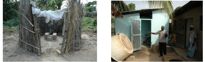
Oud & Nieuw

De pilot sanitatie-unit op het erf van de grootfamilie Diassy (ongeveer 100 mensen) blijkt goed aan te slaan.