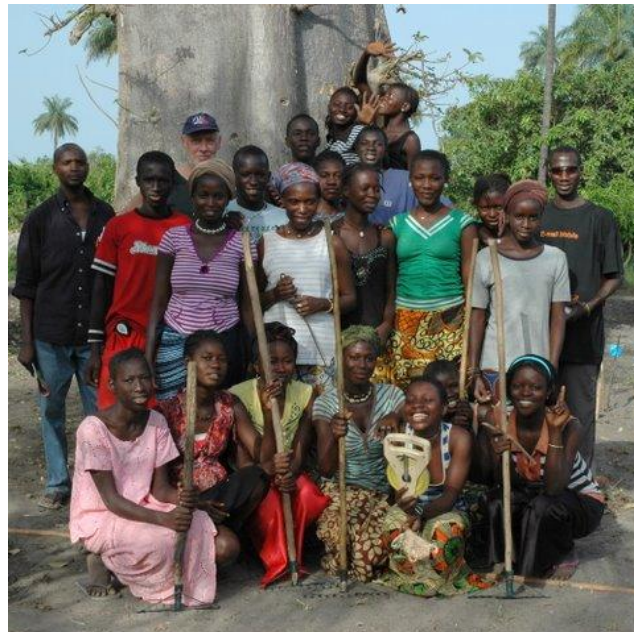
De eerste groep leerlingen

De tuinbouwopleiding voor schoolverlaters, CIPH, is na een lange voorbereiding van start gegaan met een groep van 20, meest meisjes. Deze opleiding beoogt de kinderen een vaktechnische basis te geven voor een grotere kans op een zelfstandig bestaan.