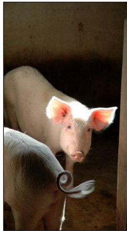
Instructie aan de telersgroep en een kijkje in de stal

De microbank CREC is in een zeer kritieke situatie verzeild geraakt. De verhouding uitstaand geld, aflossing en ingelegd spaargeld is fors uit balans. Op basis van een analyse door adviseur Gjalt Benedictus is tijdens demissie in november heel intensief overlegd met bankbestuur en management over een actieplan.