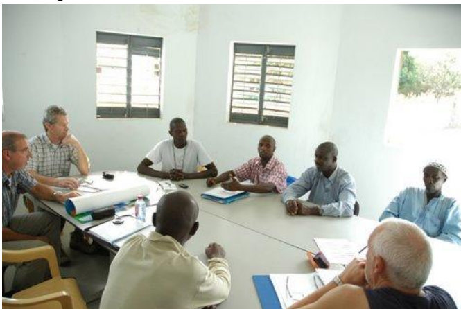
Overleg met APE over de praktijkopleiding