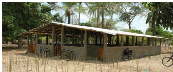
De nieuwe stal

De pilot varkenshouderij [UMUKUTA] loopt maar vraagt nog wel veel aandacht en begeleiding. Gerekend naar de plaatselijke omstandigheden is de stal erg modern.